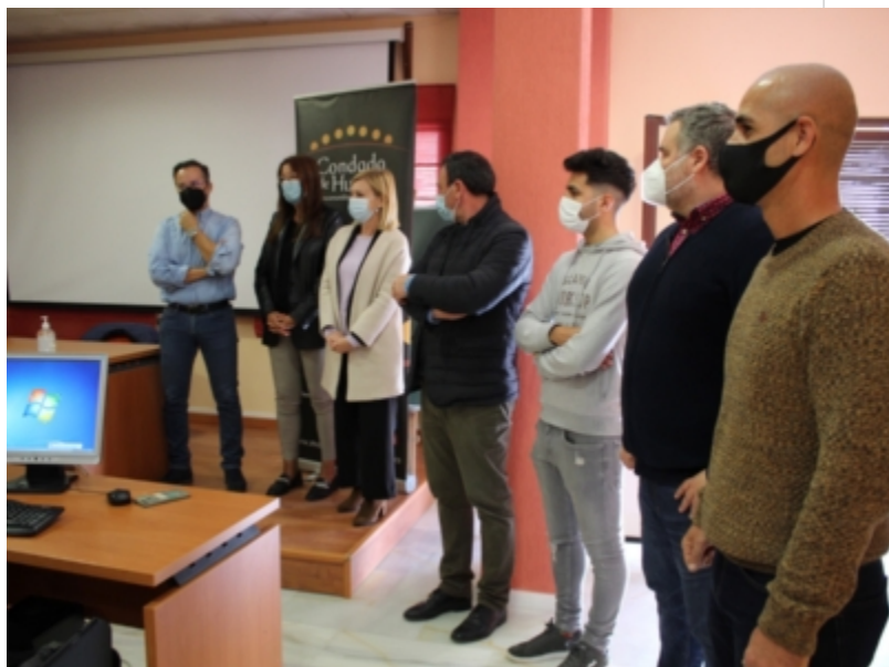
( http://www.mancondado.com/es/.galleries/imagenes-noticias/imagenes-noticias-2022/El-Programa-de-Formacion-y-Empleo-Gescondado-se-des )