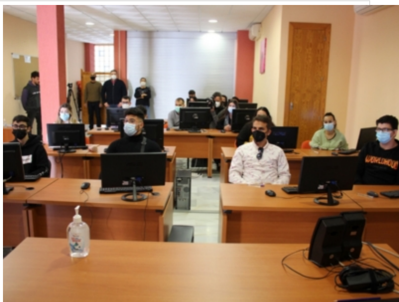
( http://www.mancondado.com/es/.galleries/imagenes-noticias/imagenes-noticias-2022/15-personas-desempleadas-de-15-municipios-de-la-comar )