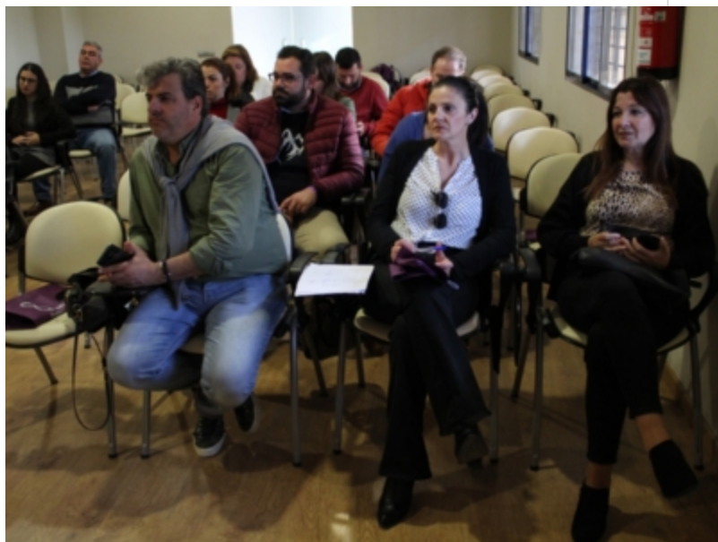
( http://www.mancondado.com/es/.galleries/imagenes-noticias/imagenes-noticias-2020/Se-ha-aprobado-por-unanimidad-la-adaptacion-de-los-sal )