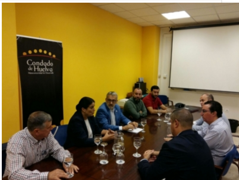
( http://www.mancondado.com/es/.galleries/imagenes-noticias/imagenes-noticias-2017/20171011-Reunion-trasvase-1.jpeg )