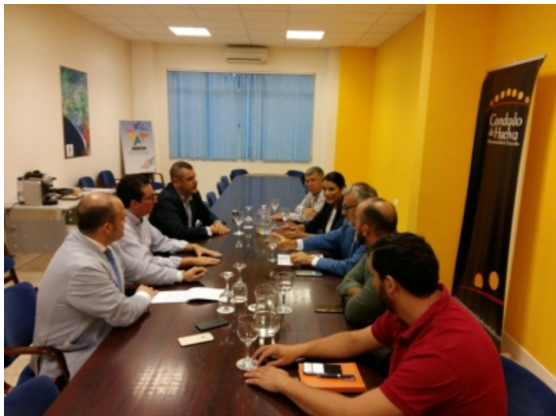
( http://www.mancondado.com/es/.galleries/imagenes-noticias/imagenes-noticias-2017/20171011-Reunion-trasvase-2.jpeg )