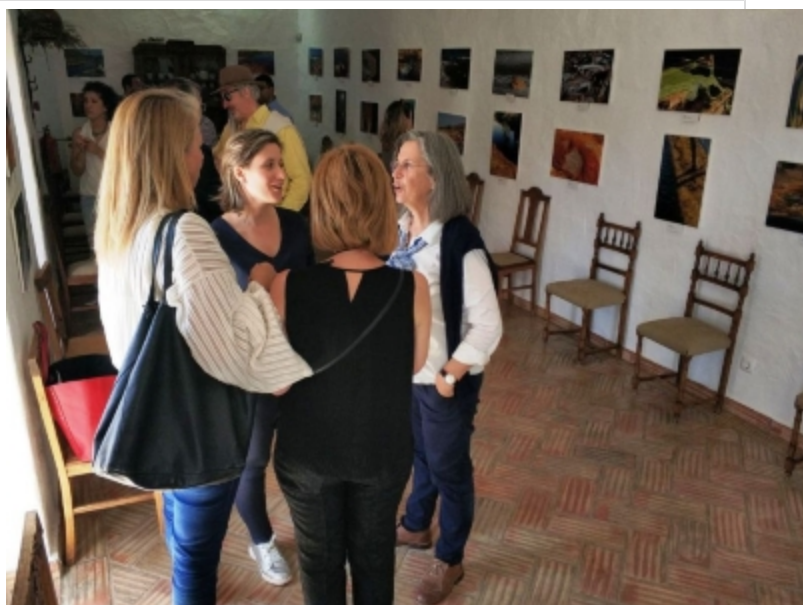
( http://www.mancondado.com/es/.galleries/imagenes-noticias/imagenes-noticias-2018/20180506-Exposicion-rio-Tinto-en-Odeleite-1.jpeg )