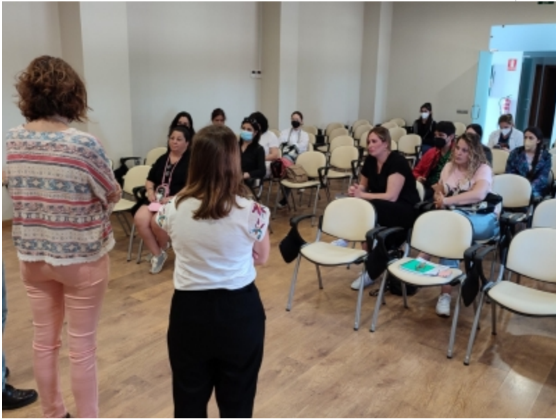
( http://www.mancondado.com/es/.galleries/imagenes-noticias/imagenes-noticias-2022/El-curso-que-cuenta-con-15-personas-beneficiarias-tiene-t )