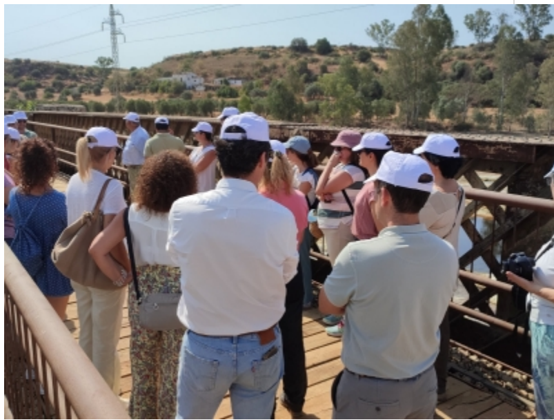
( http://www.mancondado.com/es/.galleries/imagenes-noticias/imagenes-noticias-2022/Puente-en-las-vias-del-antiguo-ferrocarril-minero.jpeg )