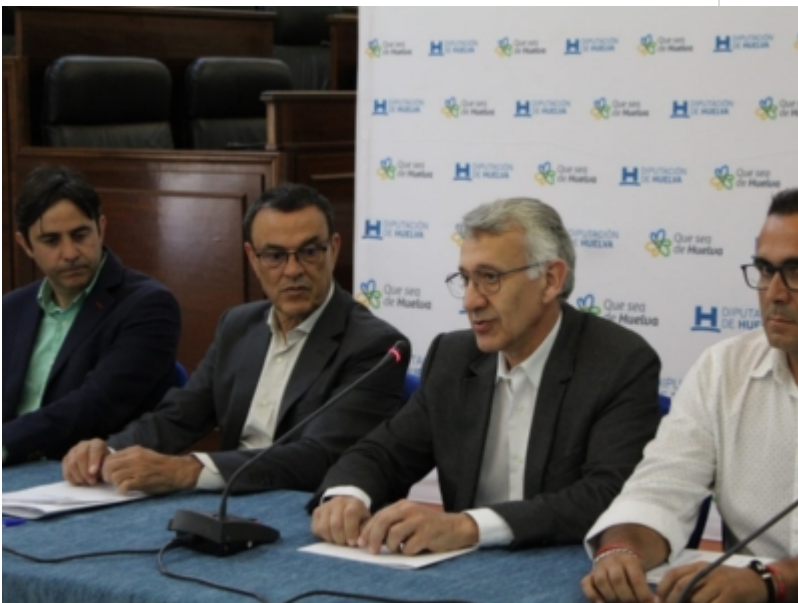
( http://www.mancondado.com/es/.galleries/imagenes-noticias/imagenes-noticias-2019/Firma-de-convenios-del-Plan-HEBE-3.jpeg )