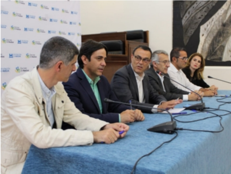
( http://www.mancondado.com/es/.galleries/imagenes-noticias/imagenes-noticias-2019/Firma-de-convenios-del-Plan-HEBE-4.jpeg )