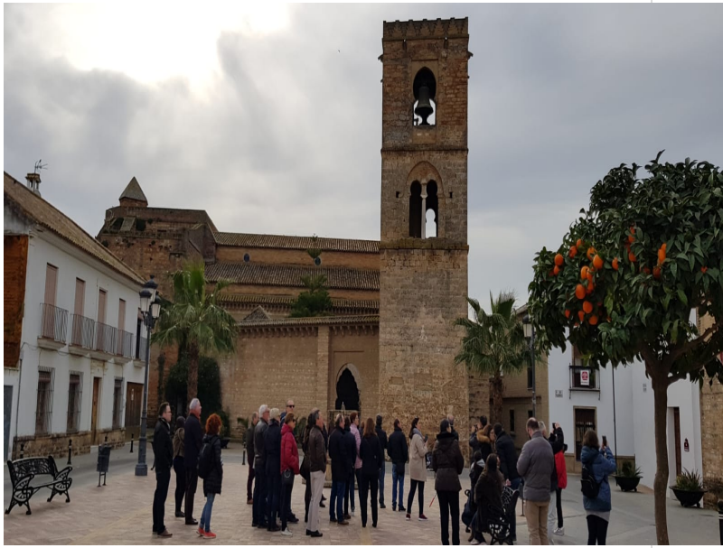
( http://www.mancondado.com/export/sites/mancondado/es/.galleries/imagenes-noticias/imagenes-noticias-2019/20190216-Visita-ACEVIN-N )