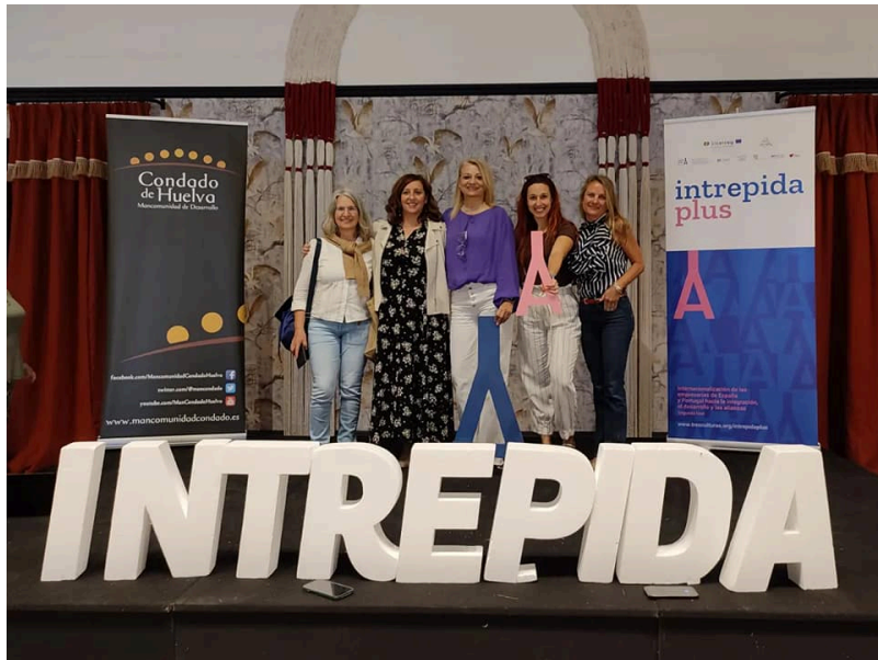
( http://www.mancondado.com/export/sites/mancondado/es/.galleries/imagenes-noticias/imagenes-noticias-2022/En-el-partenariado-del-proyecto- )