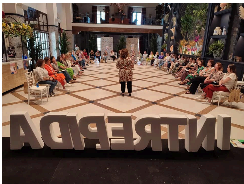
( http://www.mancondado.com/export/sites/mancondado/es/.galleries/imagenes-noticias/imagenes-noticias-2022/Durante-el-encuentro-se-trabajai )