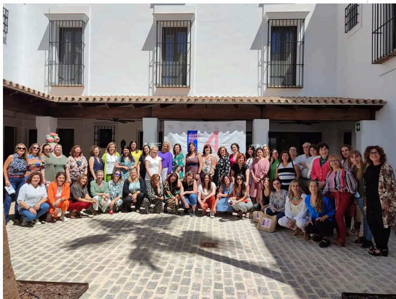
( http://www.mancondado.com/export/sites/mancondado/es/.galleries/imagenes-noticias/imagenes-noticias-2022/Mas-de-50-empresarias-participa )