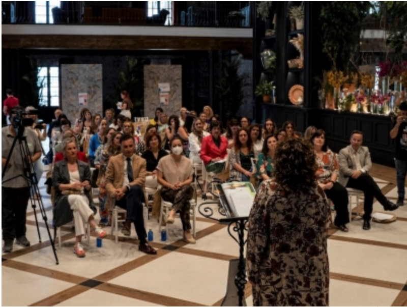
( http://www.mancondado.com/es/.galleries/imagenes-noticias/imagenes-noticias-2022/Al-encuentro-asistieron-muchos-representantes-politicos-d )