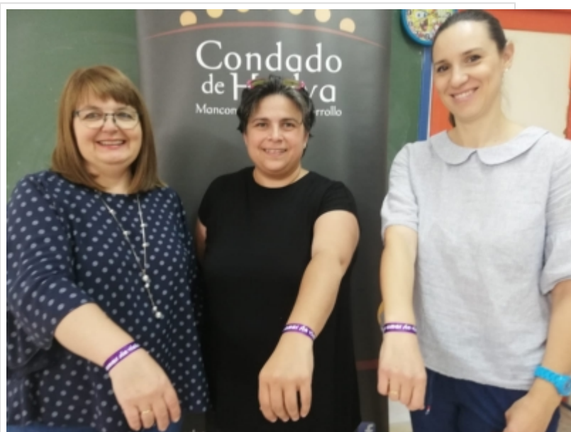
( http://www.mancondado.com/es/.galleries/imagenes-noticias/imagenes-noticias-2019/20190621-Manzanilla.jpeg )

Por último, se ha diseñado y ejecutado una acción formativa específica en relación al nuevo marco normativo de obligado cumplimiento que se establece en materia de violencia de género a raíz de firma del Pacto de Estado. Esta formación especializada dirigida a profesionales ha tenido una duración de 10 horas lectivas y se ha llevado a cabo en cada uno de los 10 municipios que han firmado el convenio con la Mancomunidad.