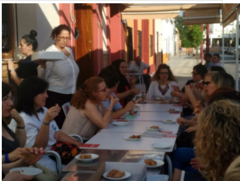
( http://www.mancondado.com/es/.galleries/imagenes-noticias/imagenes-noticias-2017/20170522-Seminario-Acompañamiento-Activo-3.jpeg )