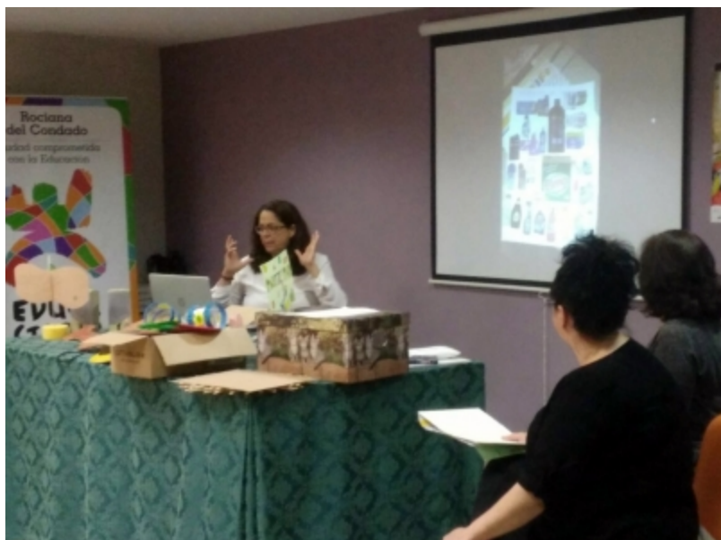
( http://www.mancondado.com/es/.galleries/imagenes-noticias/imagenes-noticias-2017/20170522-Seminario-Acompañamiento-Activo-1.jpeg )