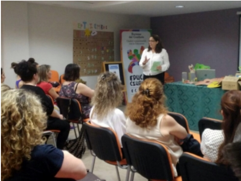
( http://www.mancondado.com/es/galleries/imagenes-noticias/imagenes-noticias-2017/20170522-Seminario-Acompañamiento-Activo-6.jpeg )