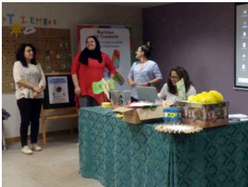
( http://www.mancondado.com/es/galleries/imagenes-noticias/imagenes-noticias-2017/20170522-Seminario-Acompañamiento-Activo-5.jpeg )