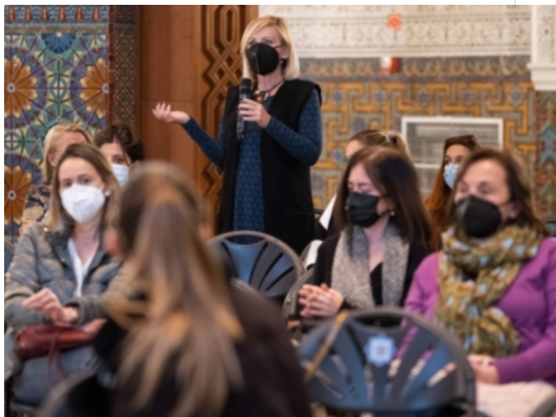
( http://www.mancondado.com/es/.galleries/imagenes-noticias/imagenes-noticias-2022/La-gerente-de-la-Mancomunidad-del-Condado-asistio-a-es )