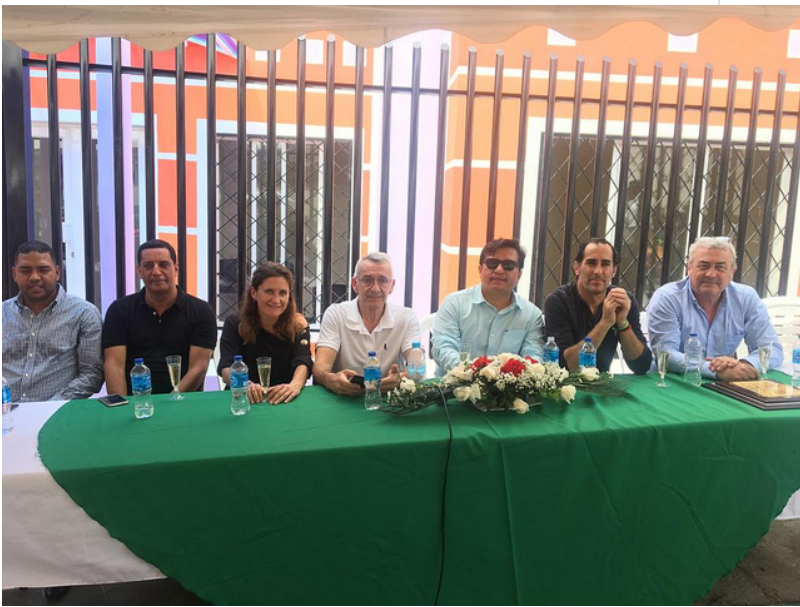
( http://www.mancondado.com/export/sites/mancondado/es/.galleries/imagenes-noticias/imagenes-noticias-2018/20181212-Mision-Ecuador-8 )