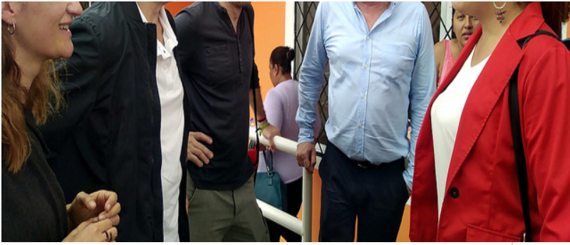
( http://www.mancondado.com/export/sites/mancondado/es/.galleries/imagenes-noticias/imagenes-noticias-2018/20181212-Mision-Ecuador-7 )