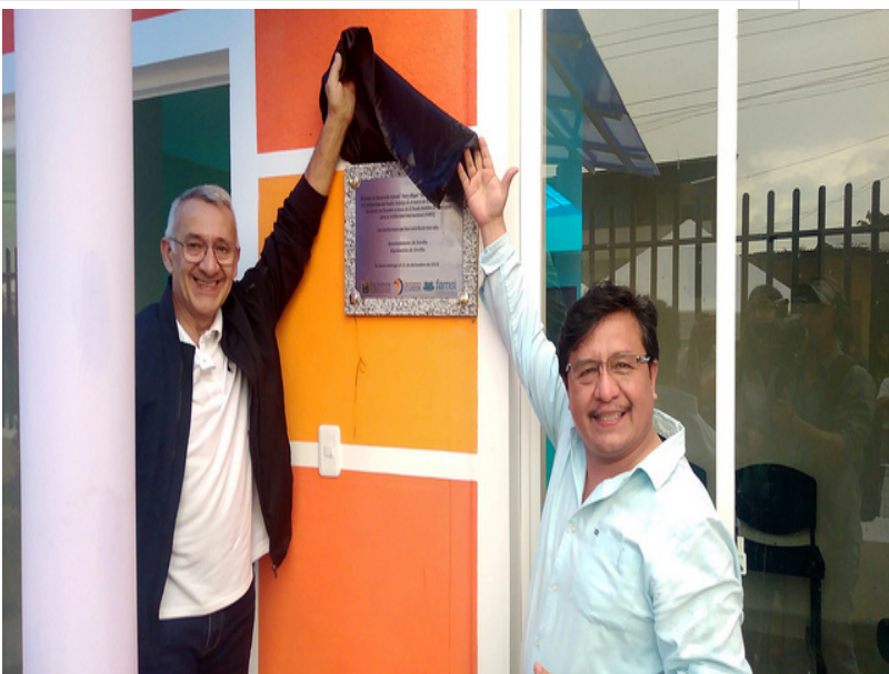
( http://www.mancondado.com/export/sites/mancondado/es/.galleries/imagenes-noticias/imagenes-noticias-2018/20181212-Mision-Ecuador-2 )