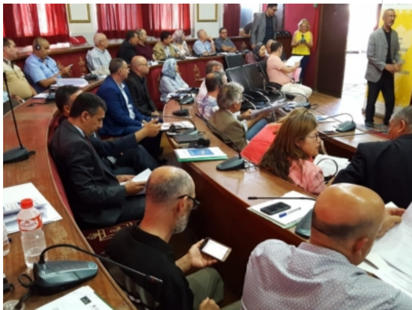
( http://www.mancondado.com/es/.galleries/imagenes-noticias/imagenes-noticias-2018/20180705-Asamblea-Federacion-Anmar-3.jpeg )