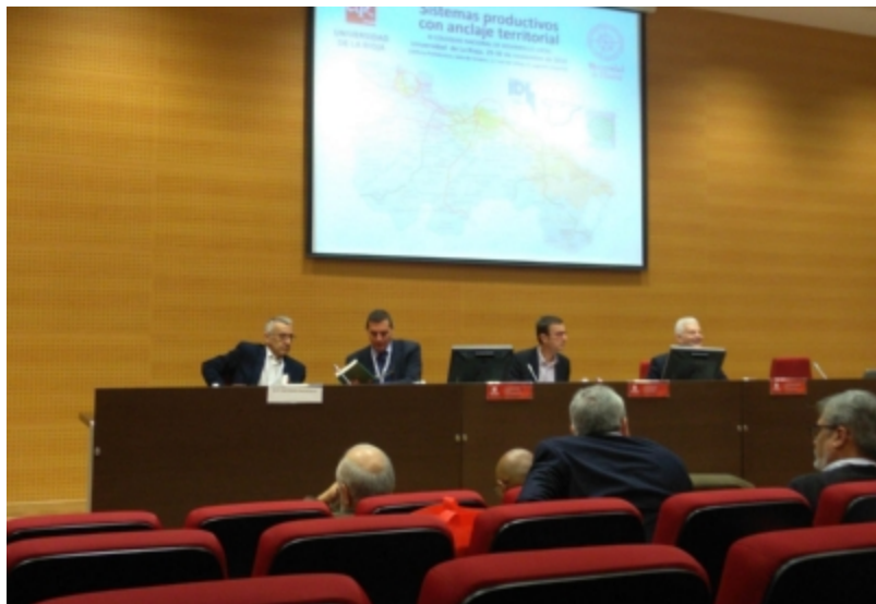
( http://www.mancondado.com/es/.galleries/imagenes-noticias/imagenes-noticias-2018/20181129-XI-Coloquio-Nacional-de-Desarrollo-Local-5.jpg )