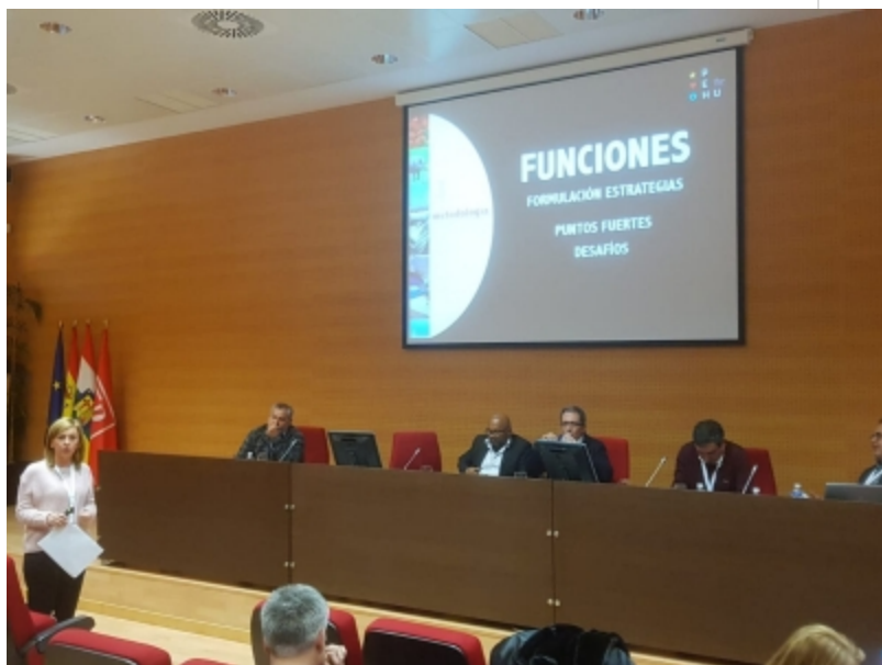
( http://www.mancondado.com/es/.galleries/imagenes-noticias/imagenes-noticias-2018/20181129-XI-Coloquio-Nacional-de-Desarrollo-Local-6.jpg )