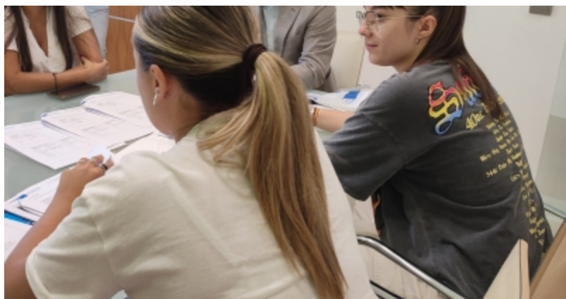
( http://www.mancondado.com/es/.galleries/imagenes-noticias/imagenes-noticias-2023/Las-alumnas-estudian-el-Ciclo-Formativo-de-Grado-Medio )