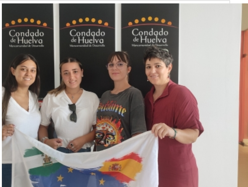
( http://www.mancondado.com/es/.galleries/imagenes-noticias/imagenes-noticias-2023/Las-alumnas-estaran-acompanadas-durante-la-primera-se )