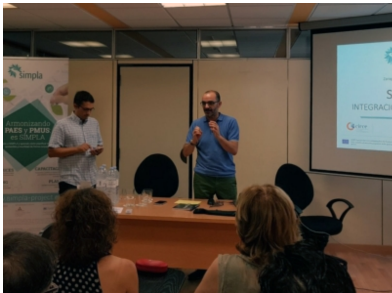
( http://www.mancondado.com/es/.galleries/imagenes-noticias/imagenes-noticias-2017/20170621-Jornadas-SIMPLA-Zaragoza-2.jpeg )