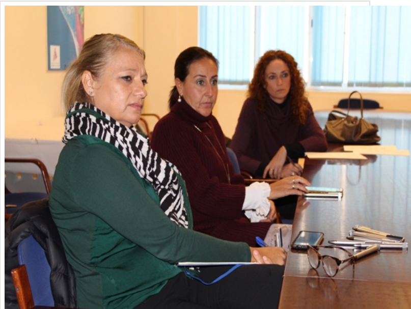
( http://www.mancondado.com/export/sites/mancondado/es/.galleries/imagenes-noticias/imagenes-noticias-2018/20181031-Reunion-cultura-s )

Este programa está financiado por la Agencia Andaluza de cooperación (AACID) y la Diputación Provincial de Huelva.