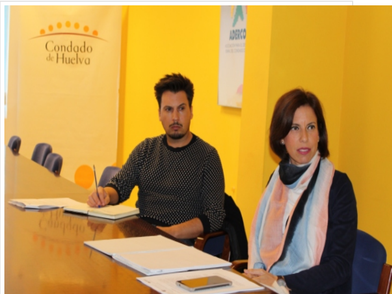
( http://www.mancondado.com/export/sites/mancondado/es/.galleries/imagenes-noticias/imagenes-noticias-2018/20181031-Reunion-cultura-s )