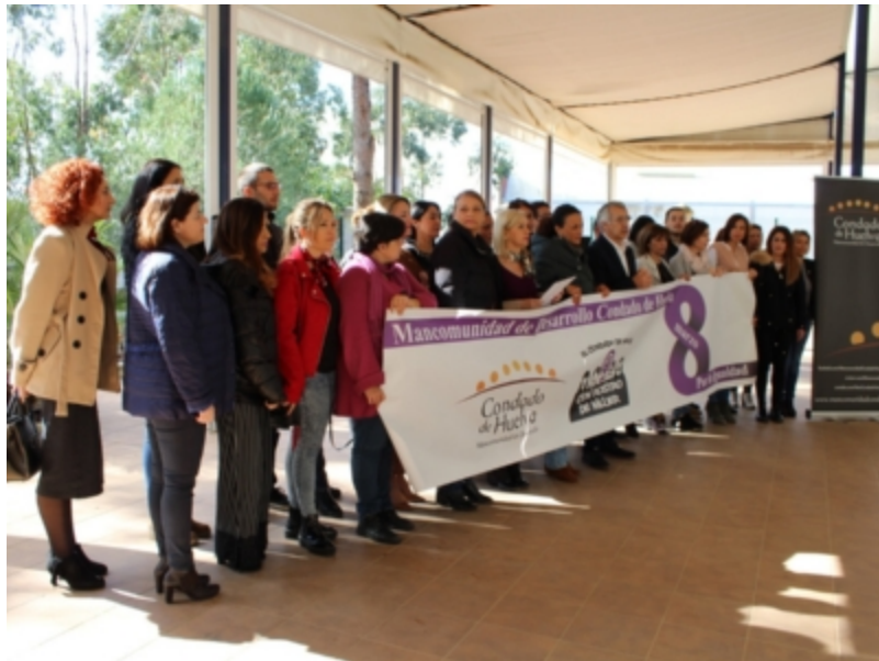
( http://www.mancondado.com/es/.galleries/imagenes-noticias/imagenes-noticias-2019/Lectura-de-manifiesto-en-la-Mancomunidad-2.jpeg )