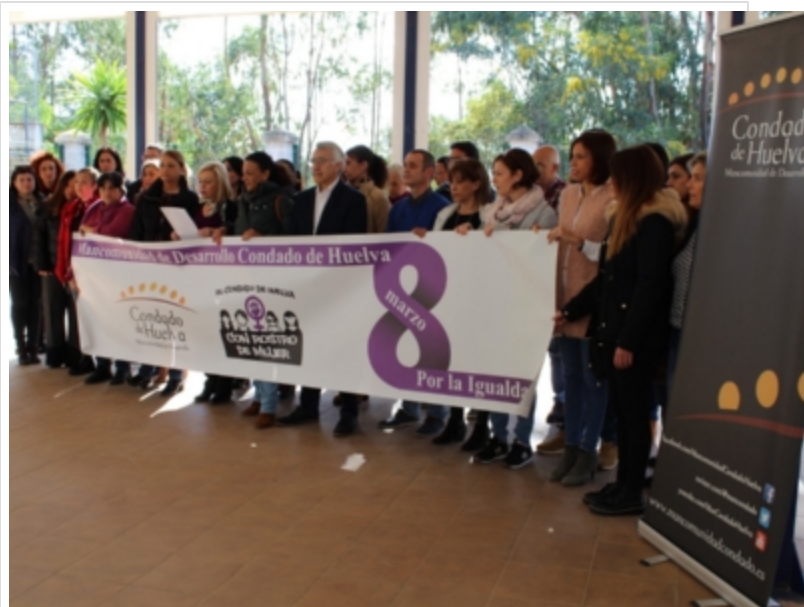
( http://www.mancondado.com/es/.galleries/imagenes-noticias/imagenes-noticias-2019/Lectura-de-manifiesto-en-la-Mancomunidad-3.jpeg )