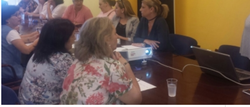
( http://www.mancondado.com/es/.galleries/imagenes-noticias/20170508-Reunion-con-asociaciones-mujeres.-Subvenciones-IAM-2.jpeg )