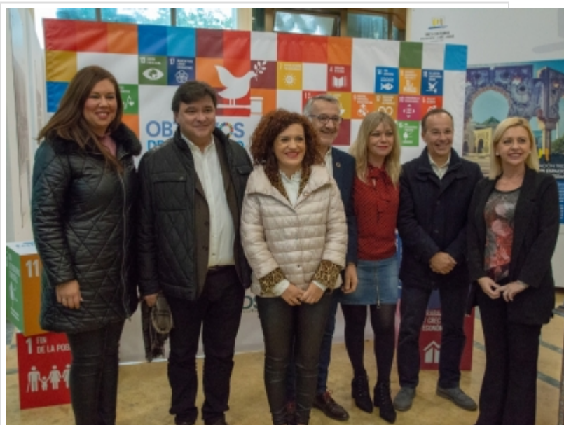
( http://www.mancondado.com/es/.galleries/imagenes-noticias/imagenes-noticias-2019/Representantes-de-Huelva-en-la-Junta-extraordinaria )

En el nuevo periodo, la nueva presidencia propone el diseño de propuestas innovadoras que impulsen políticas públicas de calidad, como pueden ser los ODS o los Foros de Desarrollo Local, y la proposición a la AACID de la incorporación del FAMSI al Consejo Andaluz de Cooperación Internacional para el Desarrollo, como actor de referencia de los gobiernos locales andaluces en esta materia. A todo ello hay que sumar la participación e implicación en redes y procesos globales para compartir miradas sobre políticas locales con estrategias globales. En definitiva, una gestión que permita incrementar de forma considerable la participación de los gobiernos locales y provinciales, liderando procesos, participando en la agenda internacional desde la mirada andaluza y conectando las políticas públicas con la agenda global, haciendo de puente con la realidad que la ciudadanía vive a diario en el territorio.