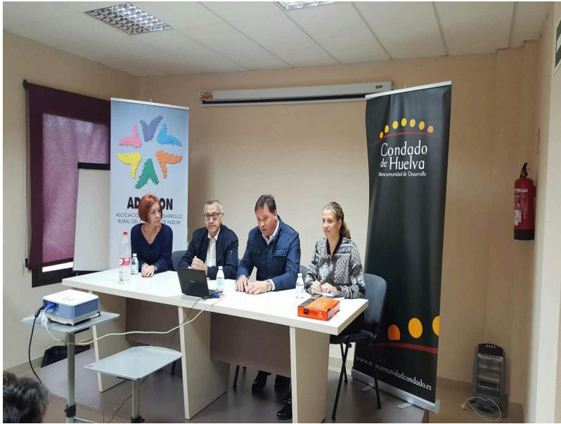
( http://www.mancondado.com/export/sites/mancondado/es/.galleries/imagenes-noticias/imagenes-noticias-2016/3-comision-agricultura.jpg )