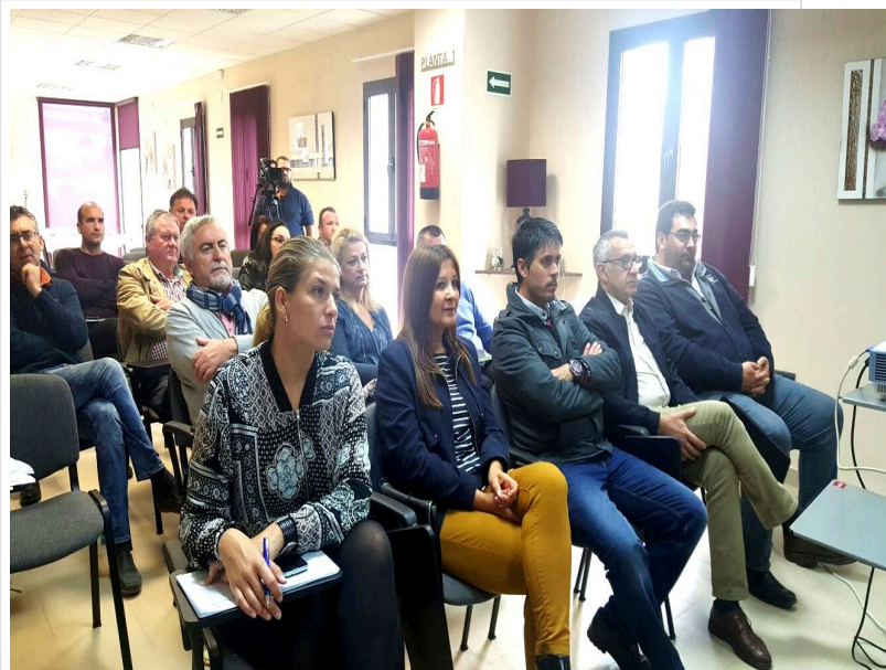
( http://www.mancondado.com/export/sites/mancondado/es/.galleries/imagenes-noticias/imagenes-noticias-2016/5-comision-agricultura.jpg )