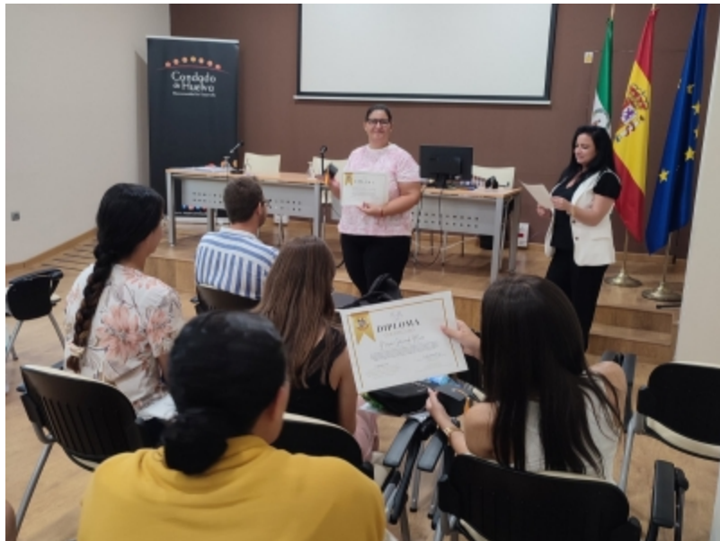
( http://www.mancondado.com/es/.galleries/imagenes-noticias/imagenes-noticias-2023/Esta-formacion-comenzo-el-pasado-mes-de-junio-y-ha-cor )