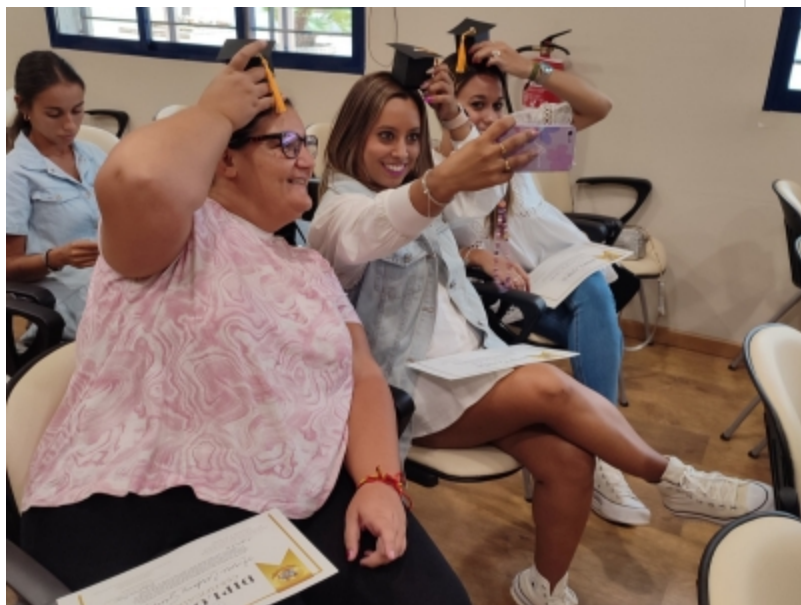
( http://www.mancondado.com/es/.galleries/imagenes-noticias/imagenes-noticias-2023/El-alumnado-podra-trabajar-como-monitor-de-educacion-y )