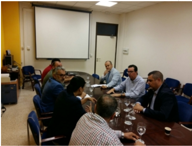
( http://www.mancondado.com/es/.galleries/imagenes-noticias/imagenes-noticias-2017/20171011-Reunion-trasvase-8.jpeg )

Esto es, sin duda, una muestra más del compromiso político de estos partidos con el esperado trasvase, al ser conscientes de la urgencia que supone para el mayor sector productivo de la comarca, la agricultura intensiva, que teme que sus cultivos, de los que dependen 40.000 puestos de trabajo, se queden sin agua de riego.