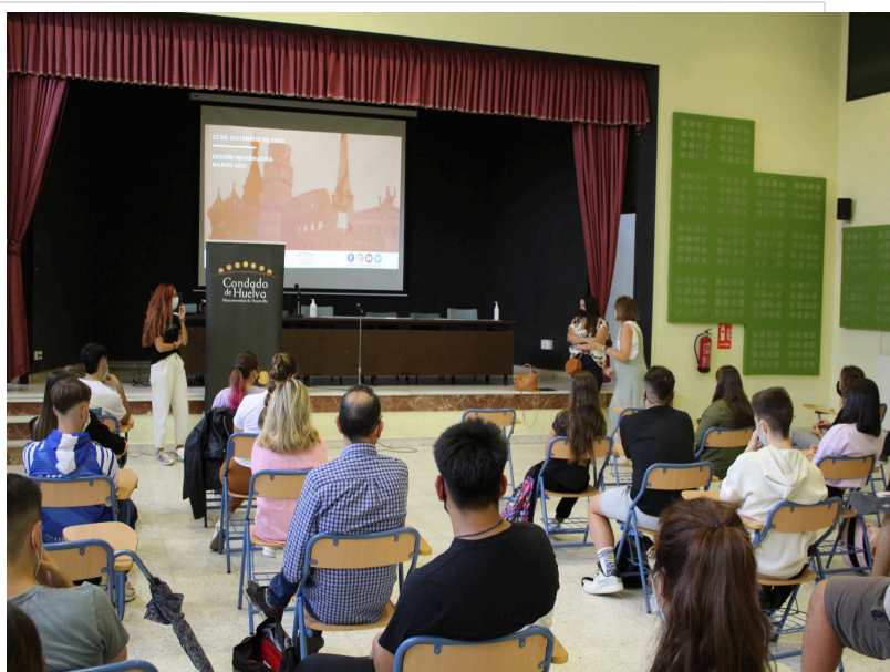
( http://www.mancondado.com/es/.galleries/imagenes-noticias/imagenes-noticias-2021/20210924-Sesion-informativa-Erasmus-en-el-IES-La-Palm )