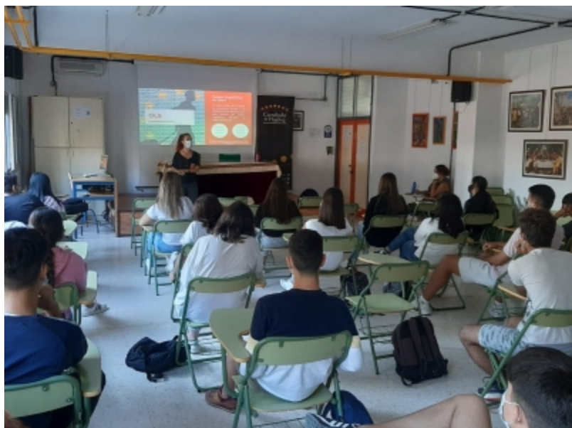
( http://www.mancondado.com/es/.galleries/imagenes-noticias/imagenes-noticias-2021/20210929-Sesion-informativa-Erasmus-en-el-IES-Catedral )