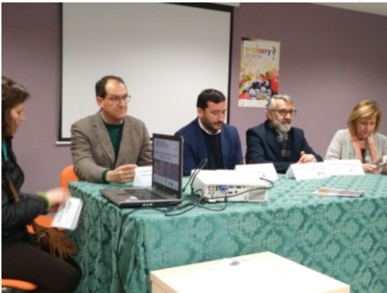
( http://www.mancondado.com/es/.galleries/imagenes-noticias/imagenes-noticias-2018/20180125-Sesion-informativa-Leader-Rociana-1.jpeg )