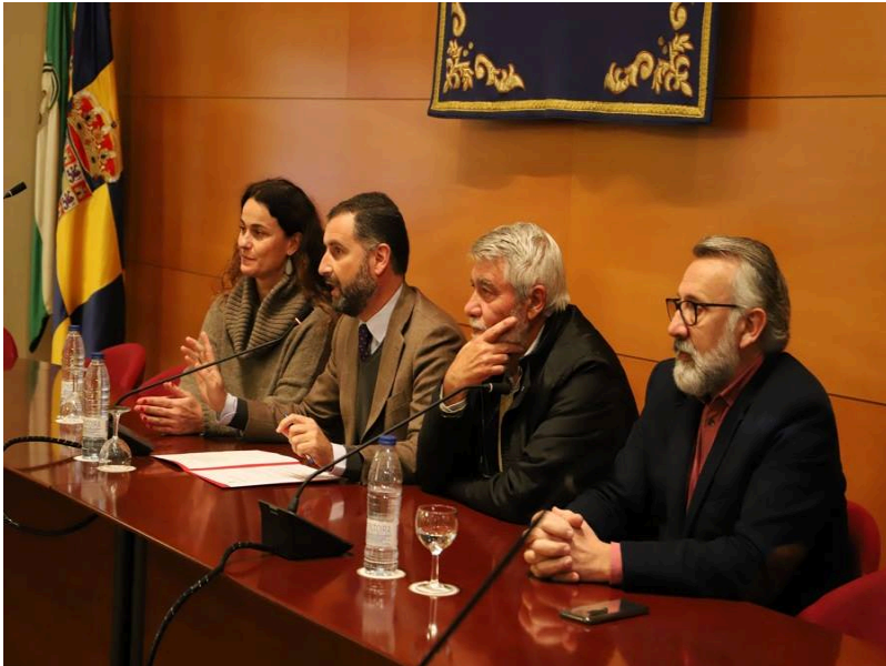
( http://www.mancondado.com/export/sites/mancondado/es/.galleries/imagenes-noticias/imagenes-noticias-2018/20180130-Sesiones-informativas )