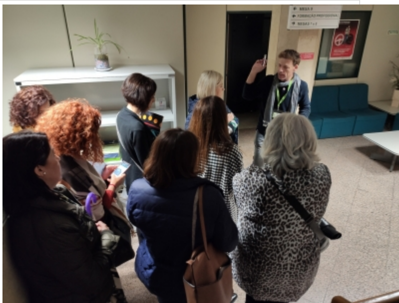
( http://www.mancondado.com/es/.galleries/imagenes-noticias/imagenes-noticias-2019/Visita-a-las-instalaciones-del-IEFP.jpeg )