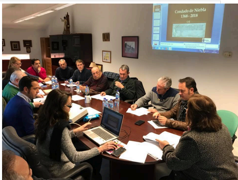
( http://www.mancondado.com/export/sites/mancondado/es/_galleries/imagenes-noticias/imagenes-noticias-2018/20180115-Reunion-coordinacion )

Con el 650 aniversario de la creación del Condado de Niebla se pretende difundir la importante y determinante historia de este territorio en el devenir de la provincia y para ello se llevarán a cabo exposiciones de documentos históricos, recreaciones históricas, cursos y seminarios en la UHU y en la UNIA, así como otras actividades lúdicas y culturales para poner en valor el protagonismo social y político de este territorio y su significativa aportación a la expansión e internacionalización de la economía provincial.