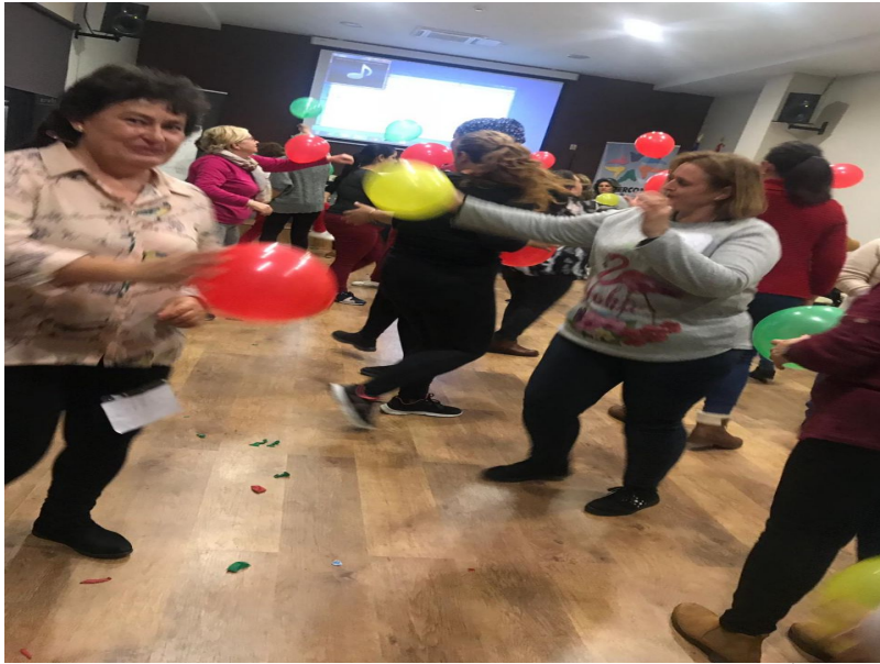
( http://www.mancondado.com/export/sites/mancondado/es/.galleries/imagenes-noticias/imagenes-noticias-2018/Formacion-DECONSA-novie )