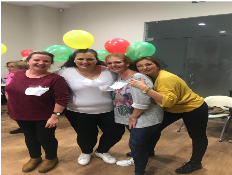
( http://www.mancondado.com/export/sites/mancondado/es/.galleries/imagenes-noticias/imagenes-noticias-2018/Formacion-DECONSA-novie )