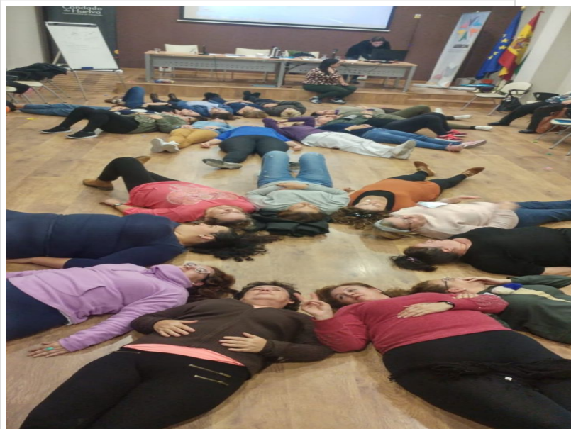
( http://www.mancondado.com/export/sites/mancondado/es/.galleries/imagenes-noticias/imagenes-noticias-2018/Formacion-DECONSA-novic )