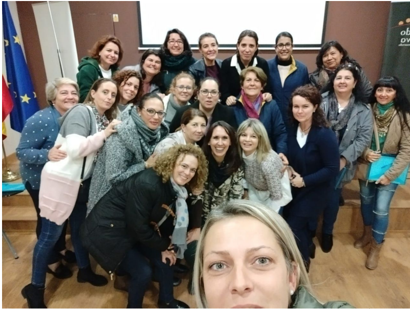
( http://www.mancondado.com/export/sites/mancondado/es/.galleries/imagenes-noticias/imagenes-noticias-2018/Formacion-DECONSA-novic )