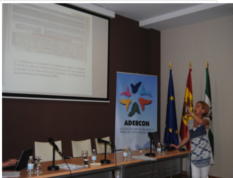
( http://www.mancondado.com/export/sites/mancondado/es/.galleries/imagenes-noticias/imagenes-noticias-2016/estrategia-4.jpg )

Además de los 'Espacios de Participación' y los 'Talleres de Diagnóstico' se utilizará una tercera herramienta de participación, los 'Cuestionarios de Diagnóstico', que recogerá de forma detallada, la opinión de los diferentes agentes clave.